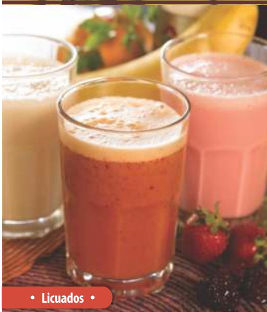
• Licuados •