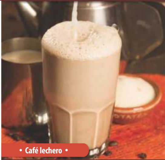
• Café lechero •