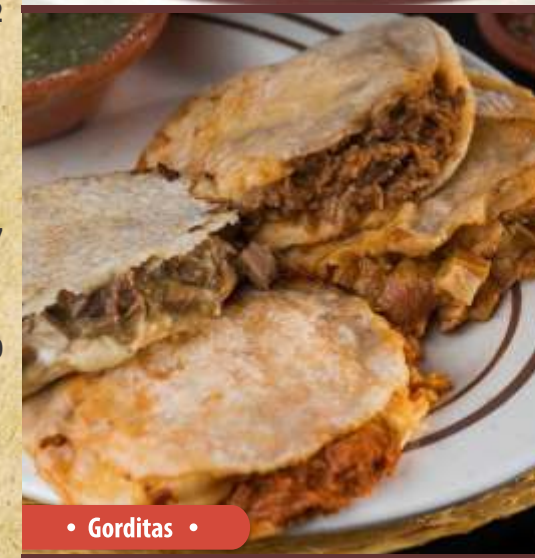
• Gorditas •