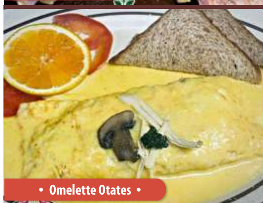
• Omelette Otates •