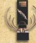
Premio Internacional México - España "Laurel de Oro a la Calidad" 2004