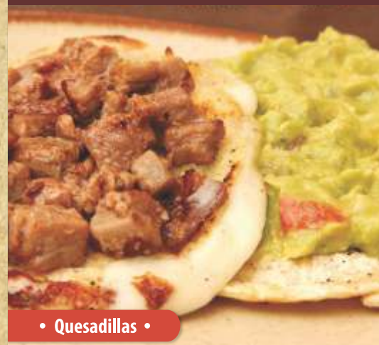
• Quesadillas •