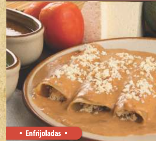
• Enfrijoladas •