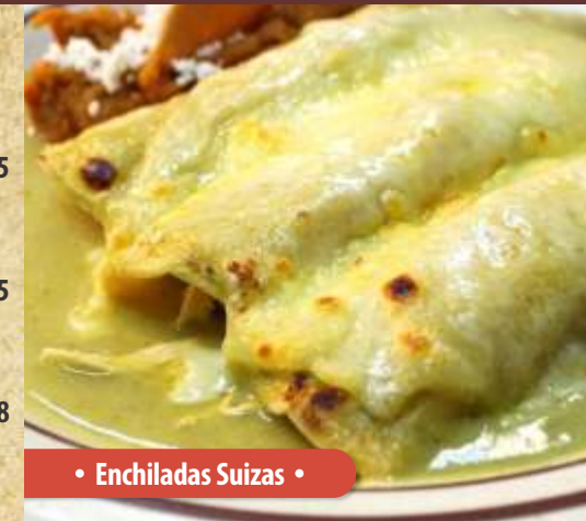
• Enchiladas Suizas •