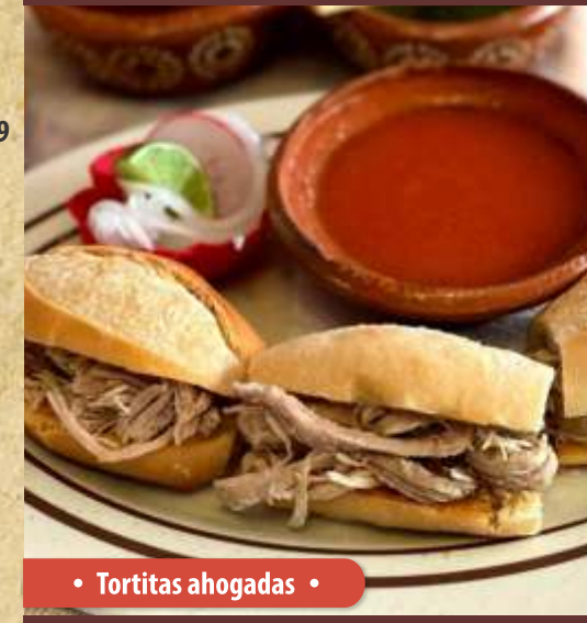
• Tortitas ahogadas •