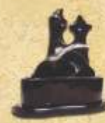
Premio Nacional de comida Típica Mexicana "María Aguirre de Arroyo" 1994