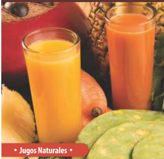
• Jugos Naturales •