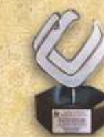
"Industrial Distinguido" Entregado por el Consejo de Cámaras Industriales de Jalisco 2011