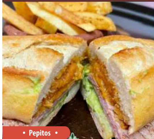
• Pepitos •