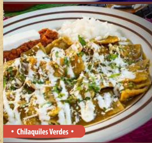
• Chilaquiles Verdes •