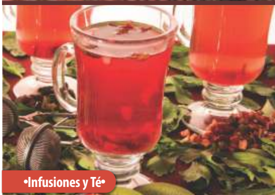
• Infusiones y Té •