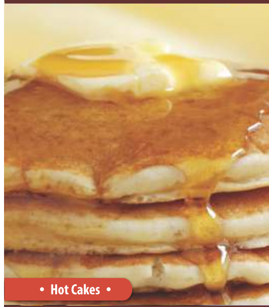
• Hot Cakes •