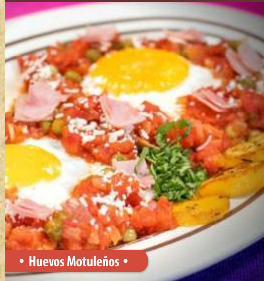
• Huevos Motuleños •