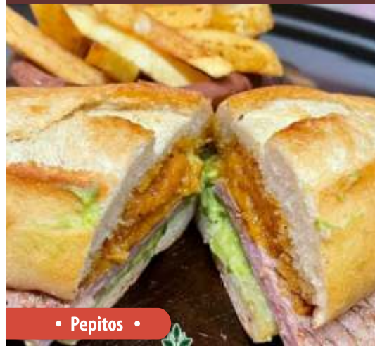
• Pepitos •