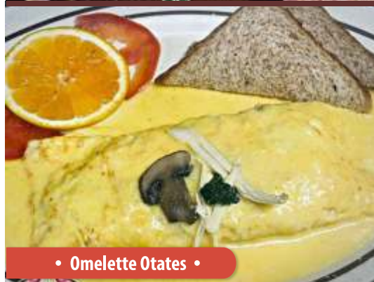
• Omelette Otates •