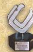
"Industrial Distinguido" Entregado por el Consejo de Cámaras Industriales de Jalisco 2011