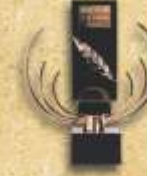
Premio Internacional México - España "Laurel de Oro a la Calidad" 2004