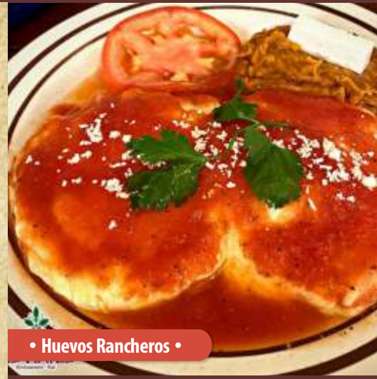
• Huevos Rancheros •