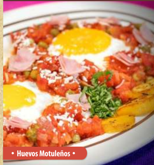
• Huevos Motuleños •