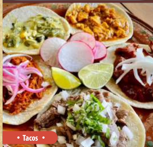
• Tacos •