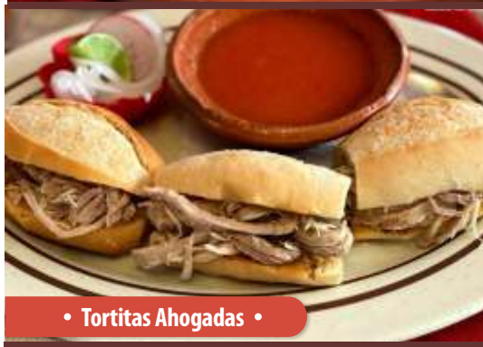
• Tortitas Ahogadas •