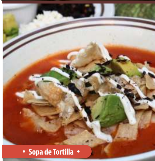
• Sopa de Tortilla •