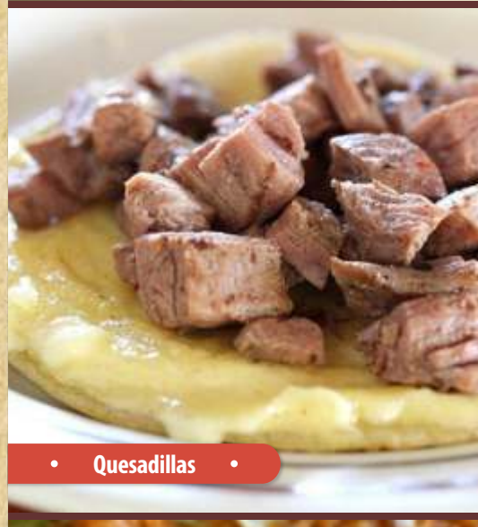
• Quesadillas •