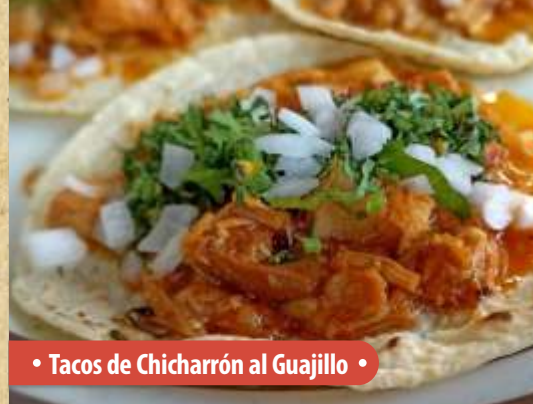
• Tacos de Chicharrón al Guajillo •