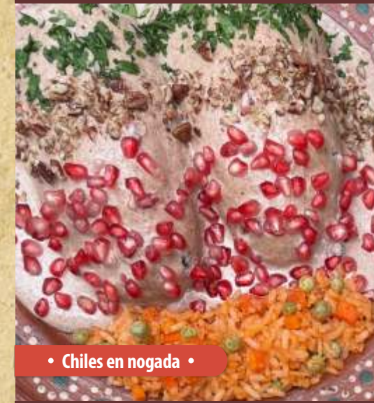
• Chiles en nogada •