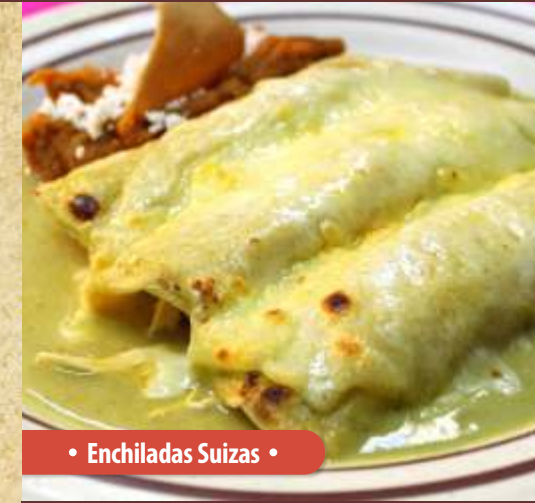
• Enchiladas Suizas •