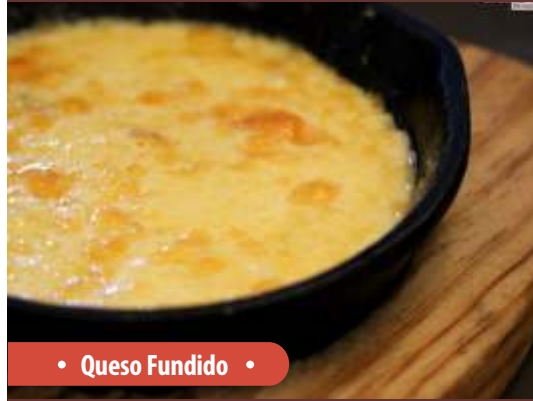
• Queso Fundido •