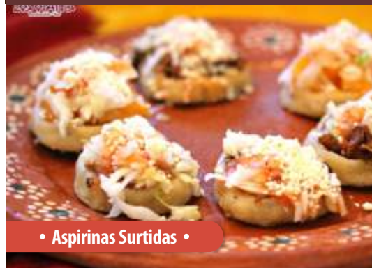
• Aspirinas Surtidas •