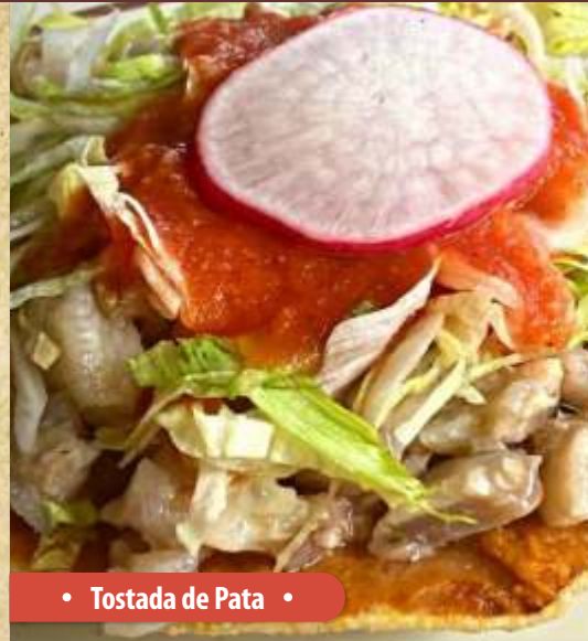
• Tostada de Pata •