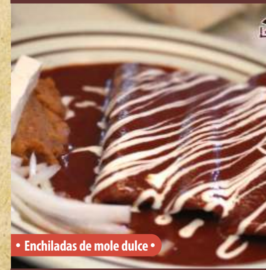
• Enchiladas de mole dulce •